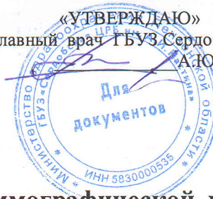
График выезда передвижной маммографической установки ГБУЗ «Сердобская ЦРБ им. А. И.Настина» на июль в Белинский район.