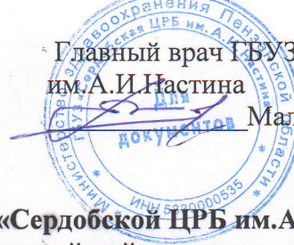
График выезда ПМК ГБУЗ «Сердобской ЦРБ им.А.И.Настина» в Бековский и Малосердобинский районы на июль 2026г ( автобус)