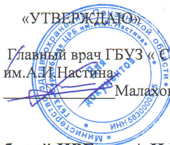
График выезда ВВБ ГБУЗ « Сердобской ЦРБ им. А.И.Настина » в сельские ЛПУ Сердобского района на октябрь 2024г