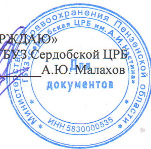
График выезда передвижной флюорографической установки ГБУЗ «Сердобская ЦРБ им. А.И.Настина» на сентябрь 2024г в г. Сердобск и села Сердобского района.