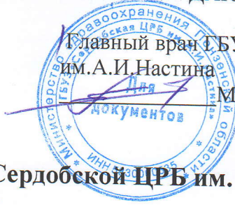
График выезда ВВБ ГБУЗ «Сердобской ЦРБ им. А.И.Настина» в сельские ЛПУ на декабрь 2023г