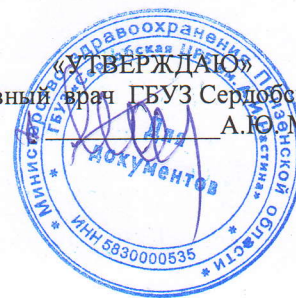
График выезда передвижной флюорографической установки ГБУЗ «Сердобская ЦРБ им. А.И.Настина» на март 2024 года в г.Сердобск и села Сердобского района.