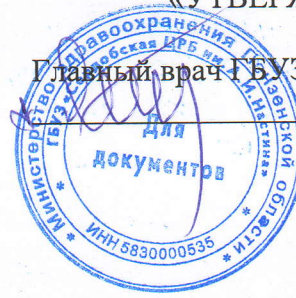
График выезда врачей специалистов ГБУЗ «Сердобской ЦРБ им. А.И.Настина» на март 2024 г. в Бековскую УБ