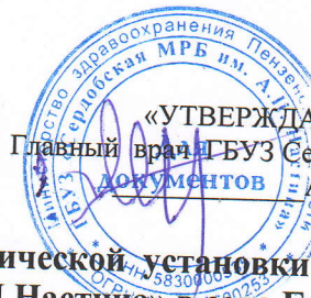
График выезда передвижной маммографической установки ГБУЗ Сердобская МРБ им. А. И. Настина» в села Городищенского района на август 2021 года.