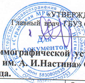
График выезда передвижной маммографической установки ГБУЗ Сердобская МРБ им. А. И. Настина» Сердобского района на август 2021 года.