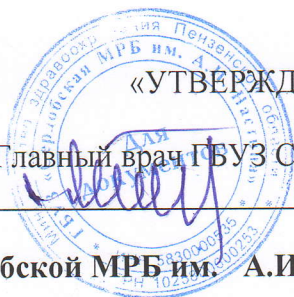
График выезда специалистов ГБУЗ « Сердобской МРБ им. А.И.Настина» на апрель 2022 г. в Бековскую УБ