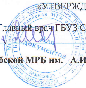
График выезда специалистов ГБУЗ «Сердобской МРБ им. А.И.Настина» на июль 2022 г. в Бековскую УБ