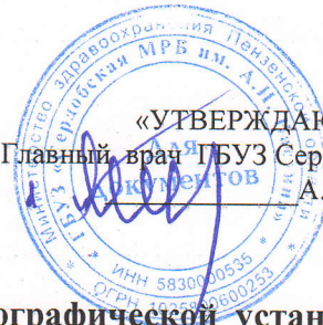
График выезда передвижной маммографической установки ГБУЗ Сердобская МРБ им. А. И.Настина» в села Бековского района на май 2022 года.