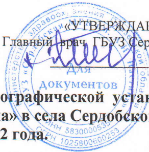
График выезда передвижной маммографической установки ГБУЗ Сердобская МРБ им. А. И.Настина» в села Сердобского района на май 2022 года.