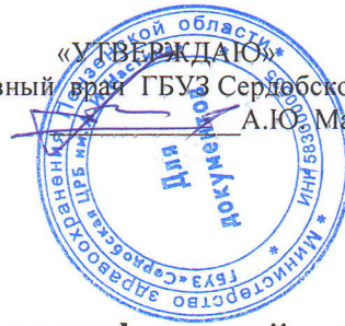
График выезда передвижной флюорографической установки ГБУЗ « Сердобская ЦРБ им. А.И.Настина» на июнь 2026г